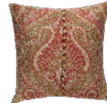
De Le Cuona produces the world's largest own-brand linen collection along with unique and contemporary wool paisleys, silk velvets and couture cashmeres

to add a pink linen, pink damask, pink velvet and also a pink wool into the collection. I see pink as being soft and feminine so I used it on masculine and textured fabrics to confuse and delight the senses.