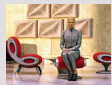
Сверху по часовой стрелке: стенд Andrew Martin на выставке Maison et Objet ; лампа Andrew Martin; кадры из фильма «Прометей» (2).