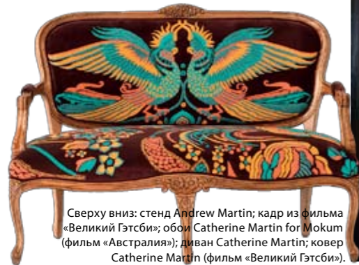
Сверху вниз: стенд Andrew Martin; кадр из фильма «Великий Гэтсби»; обои Catherine Martin for Mokum (фильм «Австралия»); диван Catherine Martin; ковер Catherine Martin (фильм «Великий Гэтсби»).