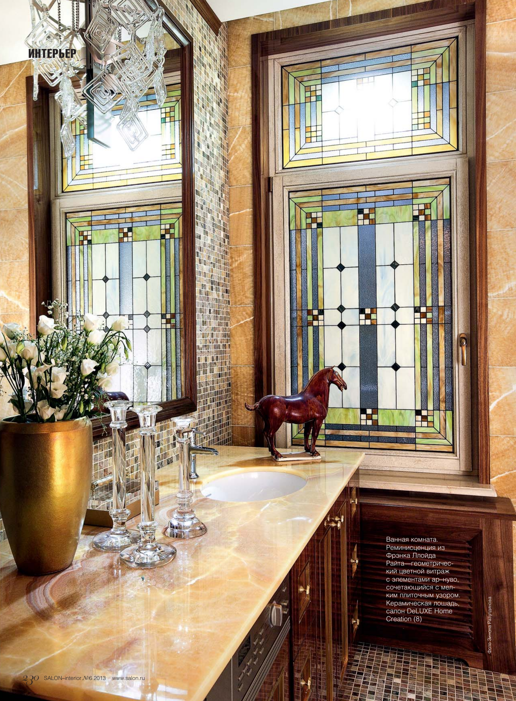
Ванная комната. Реминисценция из Фрэнка Ллойда Райта—геометриче- ский цветной витраж с элементами ар-нуво, сочетающийся с мел- ким плиточным узором. Керамическая лошадь, салон DeLUXE Home Creation (8)