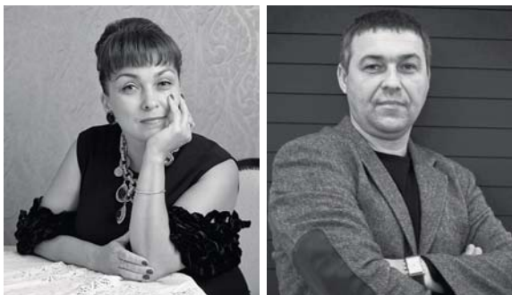
Авторы проекта архитекторы Анна Куликова, Павел Миронов