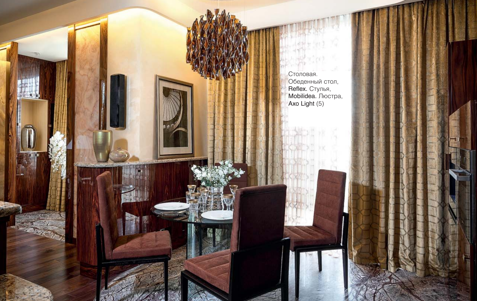
Столовая. Обеденный стол, Reflex. Стулья, Mobilidea. Люстра, Ахо Light (5)