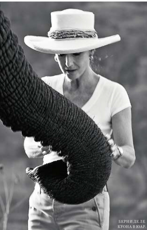
БЕРНИ ДЕ ЛЕ КУОНА В ЮАР.