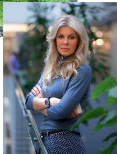
Автор проекта Анна Громова

Автор проекта АННА ГРОМОВА: «В этом интерьере нашли отражение разнообразные вкусовые предпочтения хозяев дома. Наиболее интересной, на мой взгляд, стала идея сочетания в одном пространстве предметов из разных культур и эпох. При этом оно выглядит гармонично и современно»